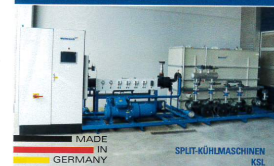
MADE IN GERMANY SPLIT-KÜHLMASCHINEN KSL