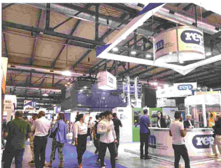
Partecipazione soddisfacente, con uno stand unico, per Rep Italiana e RPM.