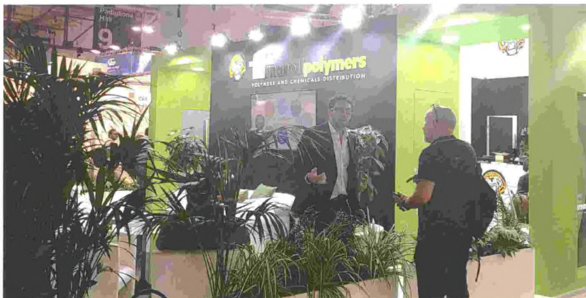
Buona l'affluenza allo stand di Fomaroli, azienda presente da poco tempo nel settore gomma.

al Plast: l'azienda è cambiata molto e positivamente in tutti i suoi comparti e siamo qui a constatare con soddisfazione un affollamento, che dimostra una vivacità del settore gomma sopra le aspettative. La fiera si rivela sempre importante per i momenti di confronto con clienti e fornitori vecchi e nuovi».