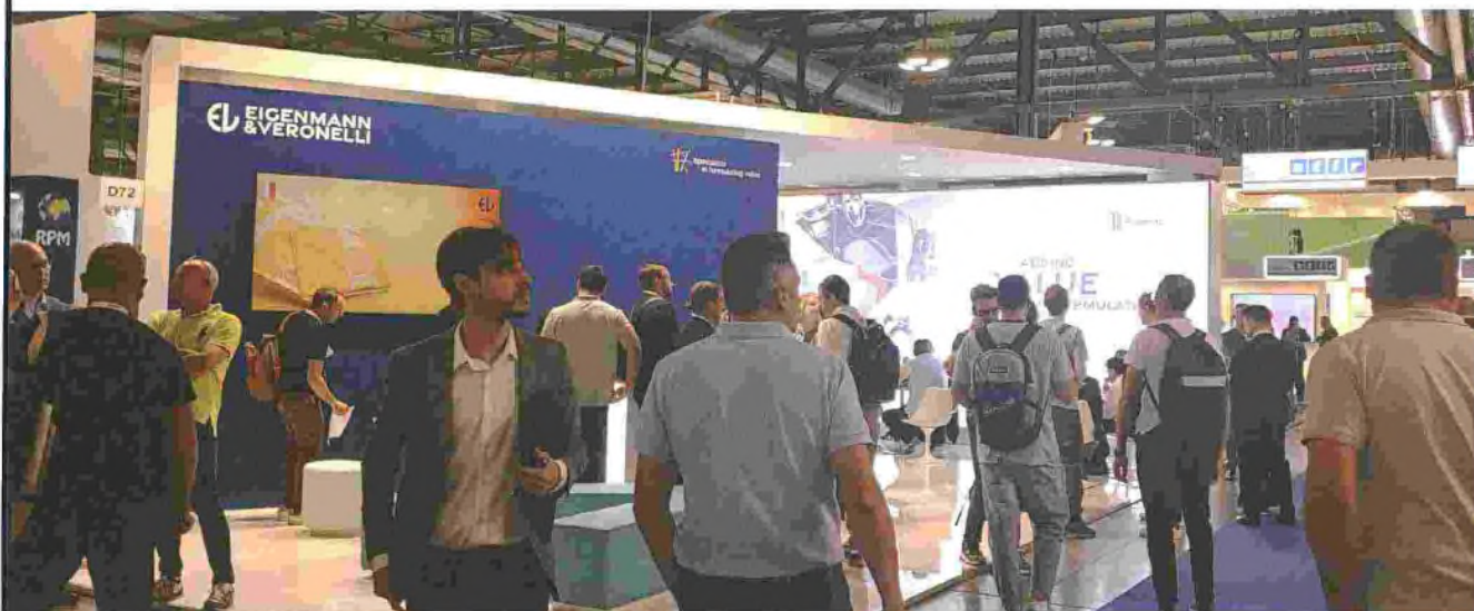
Eigenmann & Veronelli ha presentato la linea di polimeri Balance® di Versalis e il nuovo Polyplastol 25 (zinco neodecanoato), studiato e prodotto per applicazioni in gomma naturale ed SBR.

re di Tecnistamp , azienda che si occupa della progettazione e costruzione di stampi di precisione per articoli in gomma, plastica e termoplastica e che - come già in altre occasioni - era ospite allo stand di Rep Italiana: «Abbiamo notato parecchia presenza nazionale, meno internazionale. Che ci sia un intero padiglione dedicato alla gomma sicuramente aiuta, perché chi passa è interessato», ha commentato.