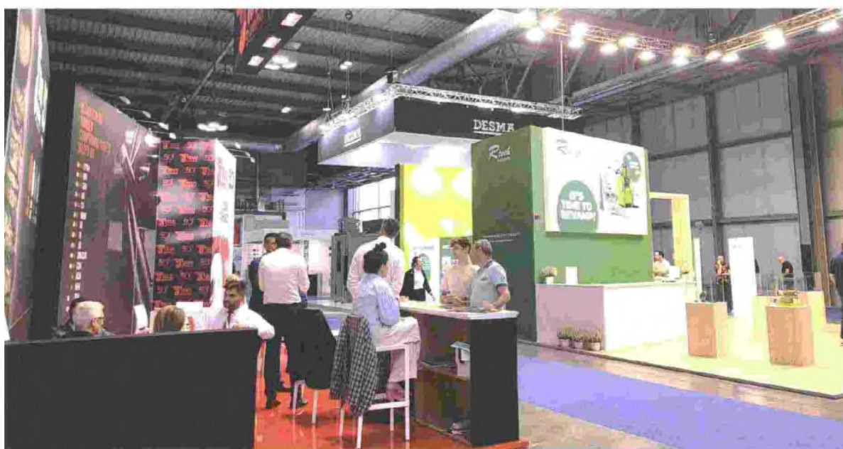
Gli stand di Tovo Gomma, RTech e – dietro – Desma nell'area Rubber.