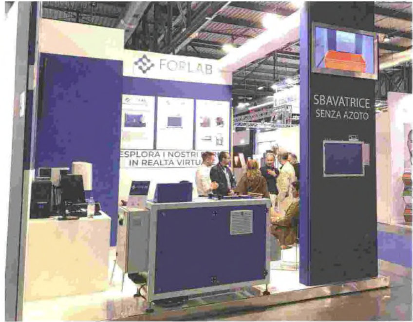
Lo stand di For Lab Italia.