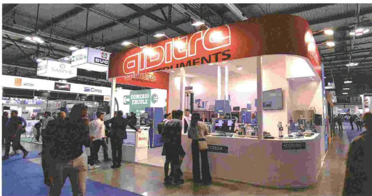
Gibitre Instruments ha presentato una nuova pressa e durometri automatici della serie Drive.